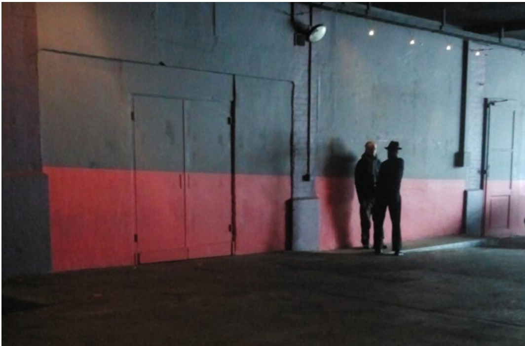
Dans la solitude des champs de coton - photo de répétition - © Graziella Antonini

Le texte de Koltès dialoguera avec la composition musicale créée et jouée en direct par Gabriel Scotti et Vincent Hänni.